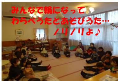
みんなで輪になって、わらべうたとあそびうた… /リ/リよ♪