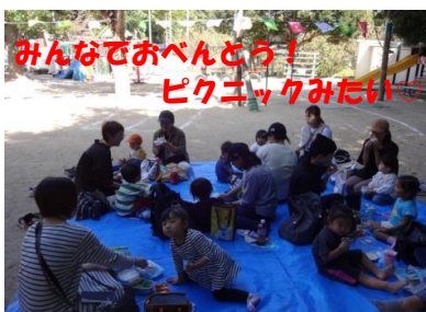
みんなでお弁当！ピクニックみたい