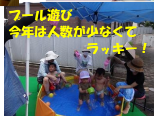
ボール遊び 今年は人数が少なくてラッキー！