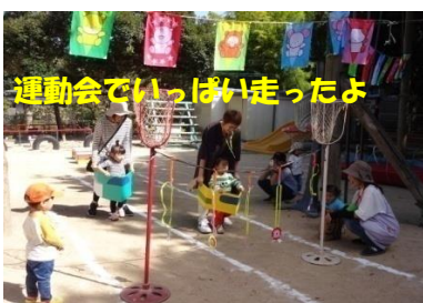
運動会でいっぱい走ったよ