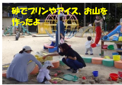
砂でプリンやアイス、お山を作ったよ