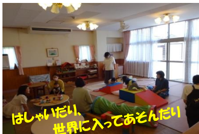
はしゃいだり、世界に入ってあそんだい

思い出がいすぎて、写真を載せ過ぎました。まだ足りません！ どの場面も思い返せば楽しかったことばかり。一緒に悩んだことも思い出に… 2024年度もみなさんにとって、良い思い出が沢山つくれますように…そして、今年度もいっぱい笑顔で、支援センターと一緒にあそびましょう！