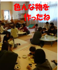
色々な物を作ったね