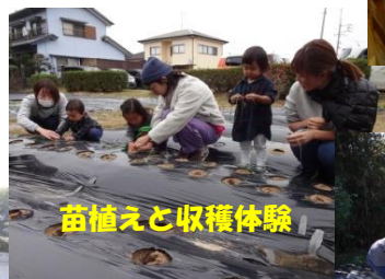
苗植えと収穫体験