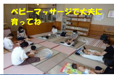
ベビーマッサージで丈夫に育ててね