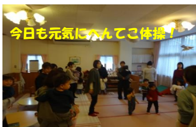
今日も元気にみんなこ体操！