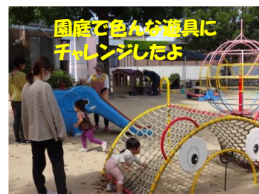
園庭で色々な遊具にチャレンジしたよ