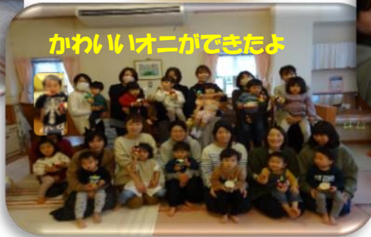
かわいいオニができたよ