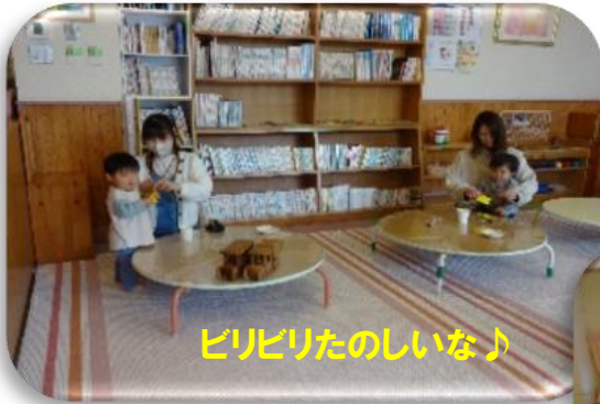
ビリビリたのしいな♪