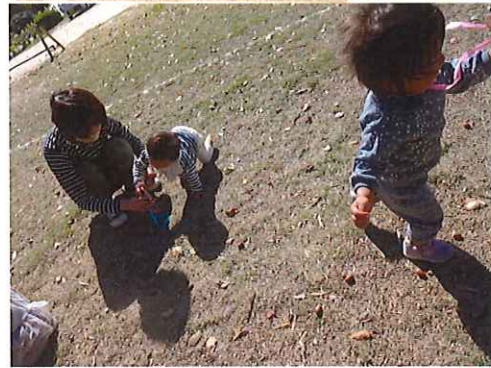
食べそうになりながらもがんばって ひろいよ♡