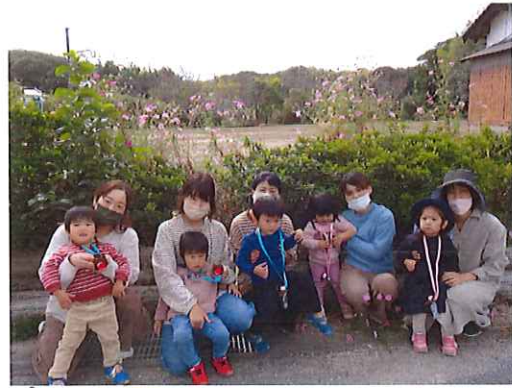
キッズサークル どんぐりひろいにお散歩へ！ みんな沢山とれたかな？