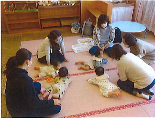
ベビーサークル みんなであそび...♡ いやされタイムですね♡