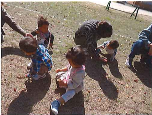
どんぐりひろいにサッカーキ場へ♡