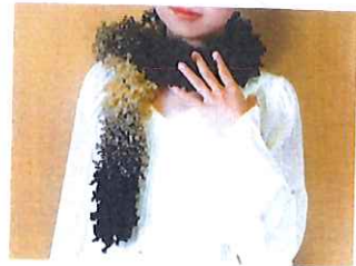
道具を使わず自分で編める、かんたんゴーヤスなマフラー

冬を先取り、ゴーヤスなマフラーを編んでみましょう！道具のいらない「ゆび編み」で、たった30分ほどで編めるマフラーです。